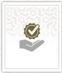
أماكن و مواعيد