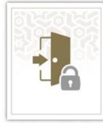
تسجيل دخول الطلاب