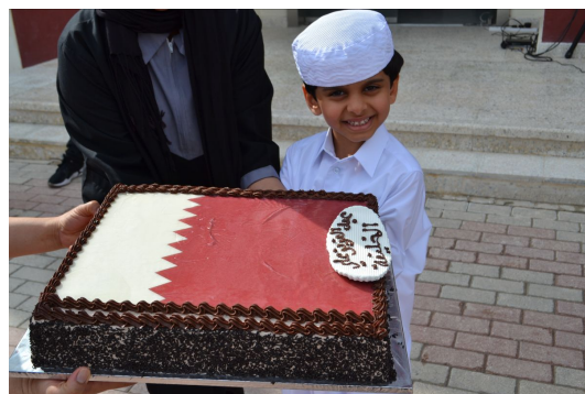
احتفالات اليوم الوطني في أكاديمية قطر - السدرة