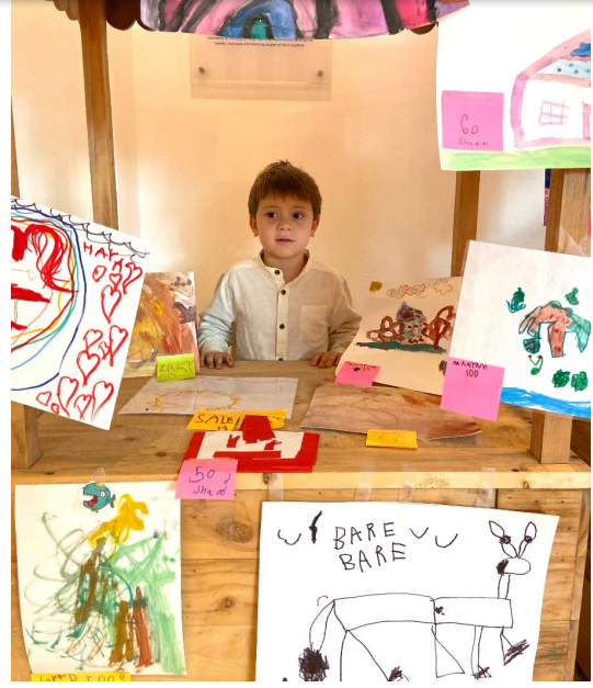
طارق بن زياد Tariq Bin Ziad